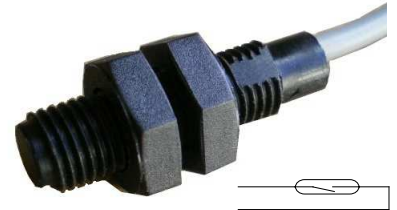
M8 Boîtier plastique Plastic housing