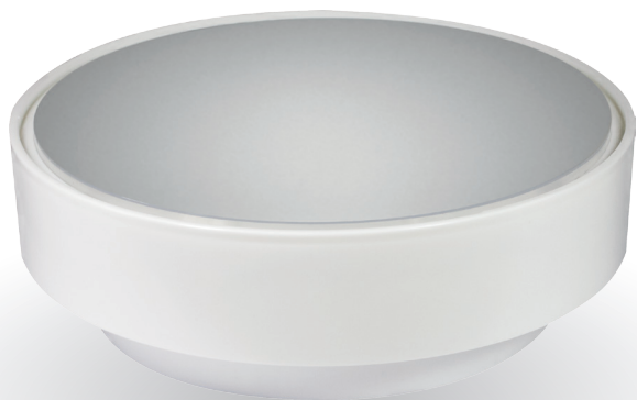
Oprawa ścienna i sufitowa